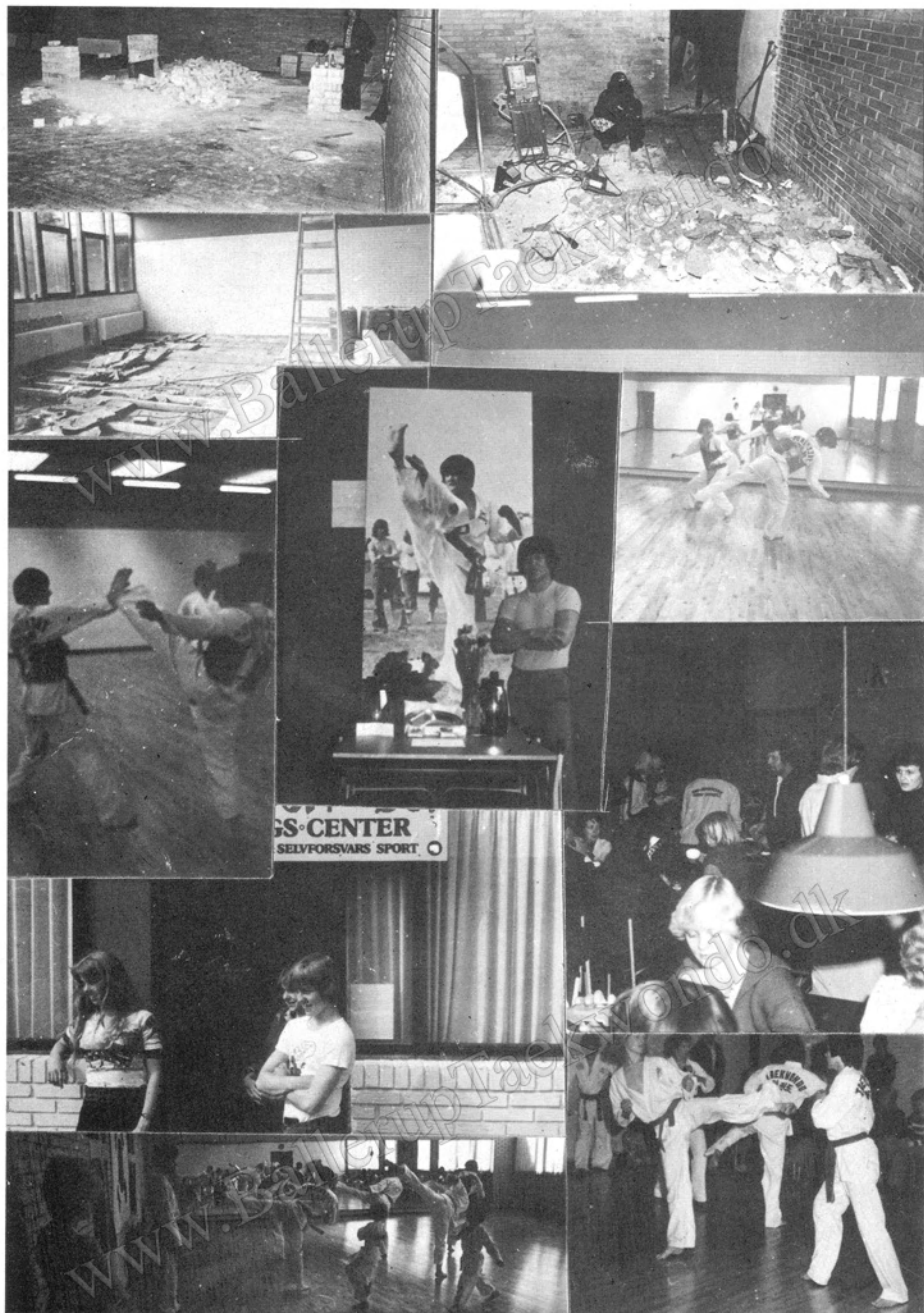
Billeder fra reception, træning og lokaltueter i Esbjerg Cheoung Yong før der blev færdigt og efter.