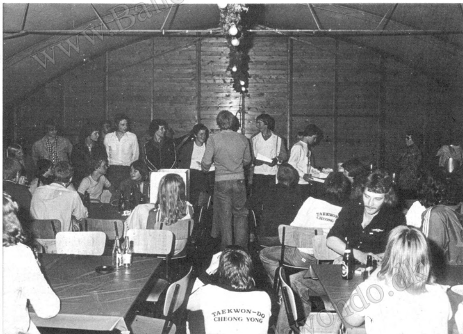
Sommerlejr 78. Uddeling af minde fra Bramming by i anledning af 1. Dan graduering.